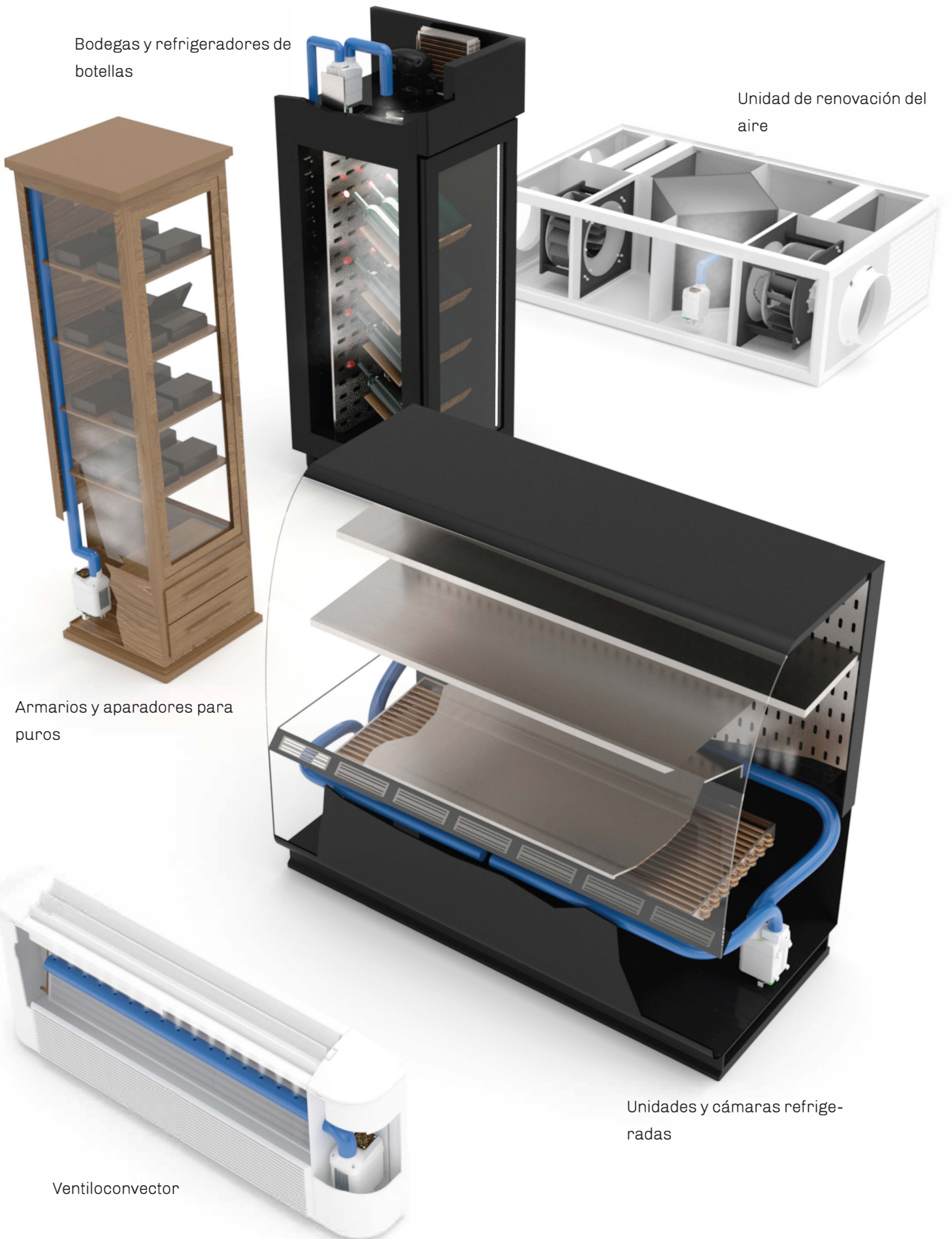
Unidad de renovación del aire