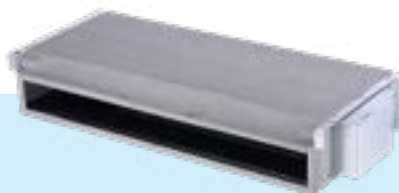
CFFU para encastrar