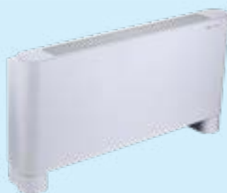
CFFC a la vista