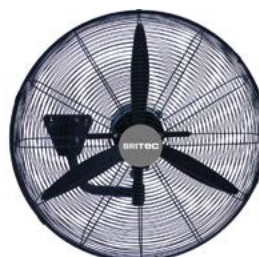
BDFP 500 / 600-TW