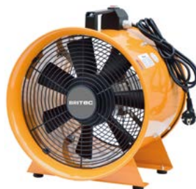
BPVT 20 / 25