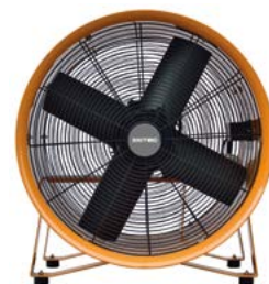
BPVT 30 / 35 / 40 / 45 / 50