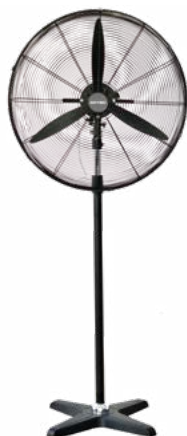
BDFP 650 / 750 - T