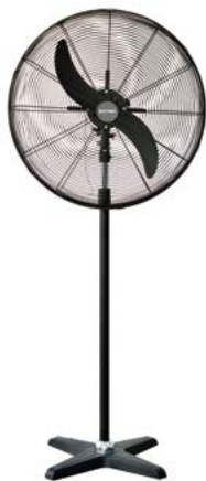
BDFP 500 / 600 - T