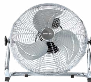
BFE4 40 / 45 / 50