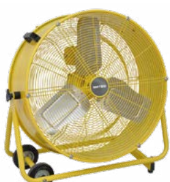
BHVF 60 L