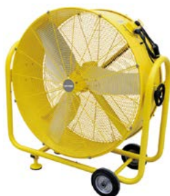
BHVF 90 L