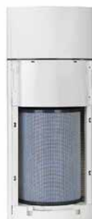
FILTRO DE SUBSTITUIÇÃO AIRPURE BP 400

Ref.: 42R0FBP400 Cód EAN: 8436596290488 Preço: 94 €