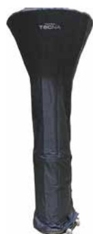
Capa protetora impermeável para aquecedor CORONA (PRETO)

Com uma potência de 13 kW e uma área de aquecimento entre 20 e 30 m 2 . A sua estética cuidada e o sistema suave de transmissão de calor tornam-no ideal para aquecer terraços, alpendres, lounges, bares e restaurantes em geral. Disponível em inox, branco e preto.