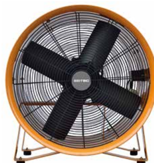
BPVT 30 / 35 / 40 / 45 / 50