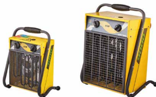
BHP-M / 5 / 9 / 15