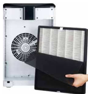
FILTRO DE SUBSTITUIÇÃO AIRPURE BP 300

Ref.: 42R0FBP300 Cód EAN.: 8436596290471 Preço: 62 €