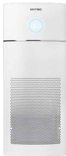
Purificador HEPA H13 + medidor CO 2 com avisador luminoso de abertura de janela "2 em 1"