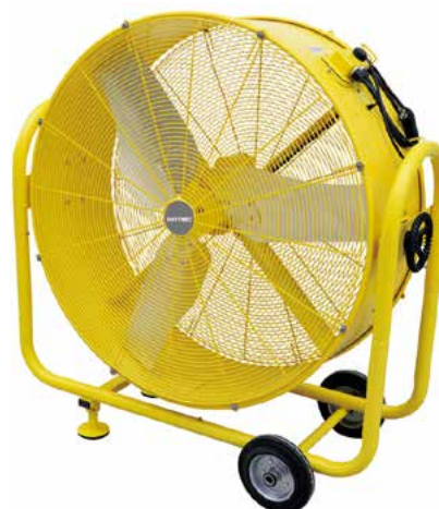
BHVF 90 L