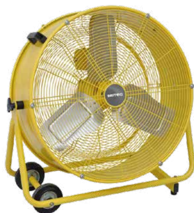
BHVF 60 L