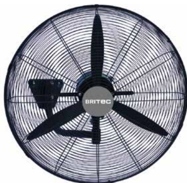
BDFP 500 / 600-TW