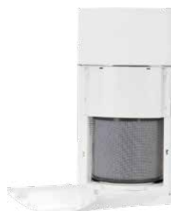
FILTRO DE SUBSTITUIÇÃO AIRPURE BP500-CO 2

Ref.: 42R0FBP500 Cód EAN.: 8436596290495 Preço: 125 €