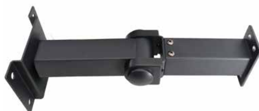
Braço de suporte incluído