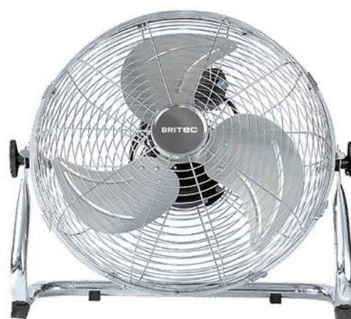
BFE4 40 / 45 / 50