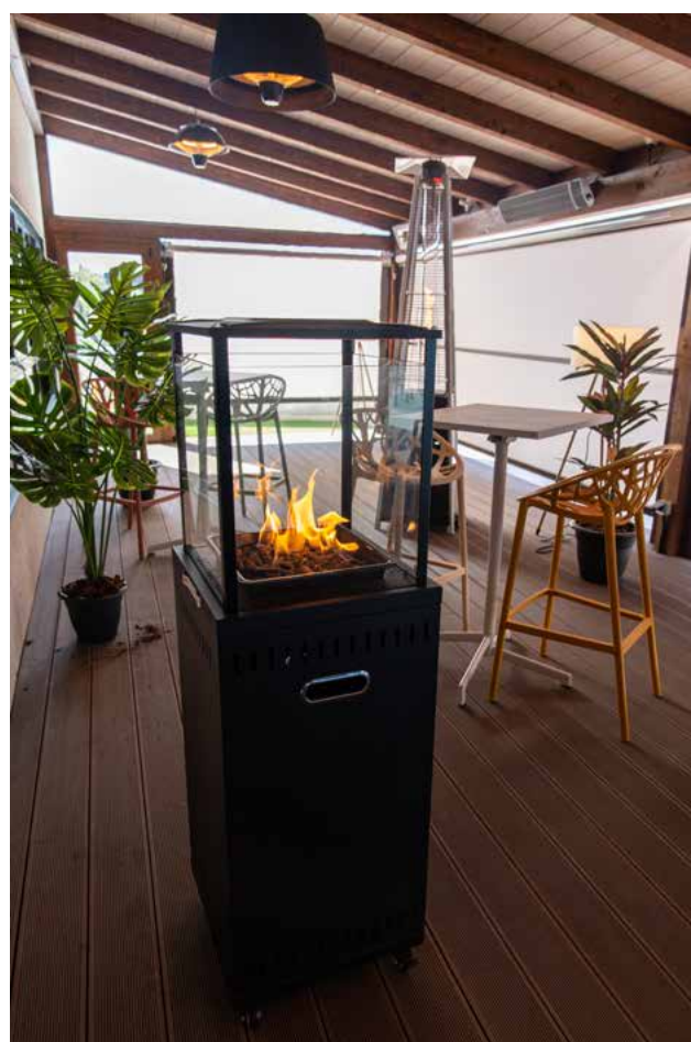
Inclui pedra de lava vulcânica