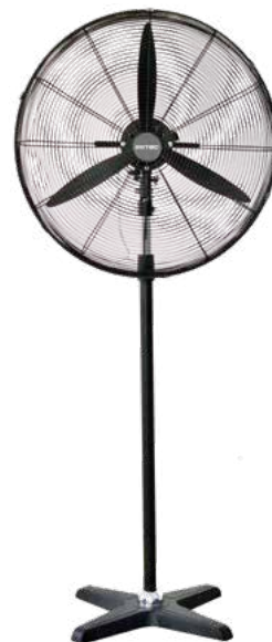
BDFP 650 / 750 - T