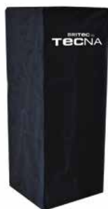
Capa protetora impermeável para aquecedor OSLO (PRETO)

Possui troncos artificiais no interior, conferindo-lhe um toque de lareira tradicional perfeito. Apresenta três faces em vidro que permitem ver as chamas de qualquer ângulo e distribuir o calor de forma uniforme, e uma face traseira fechada, ideal para colocação junto a uma parede. Modelo de 4 faces também disponível.