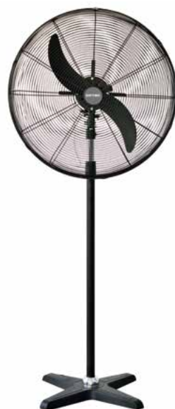
BDFP 500 / 600 - T