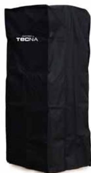
Capa protetora impermeável para aquecedor SAMOA (PRETO)

Combina um design atrativo e moderno, concebido para criar um ambiente agradável e acolhedor de forma instantânea, transformando os espaços num verdadeiro ponto de destaque e de bem-estar. Por isso, são produtos ideais tanto para hotelaria como para terraços ou alpendres residenciais.