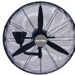
BDFP 500 / 600-TW