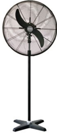
BDFP 650 / 750 - T