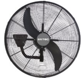
BDFP 650 / 750-TW