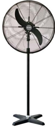
BDFP 650 / 750 - T