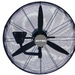
BDFP 500 / 600-TW