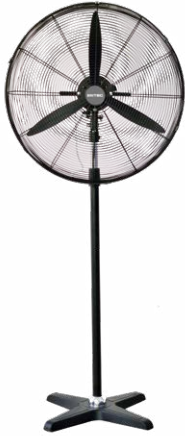
BDFP 500 / 600 - T