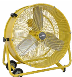
BHVF 60 L